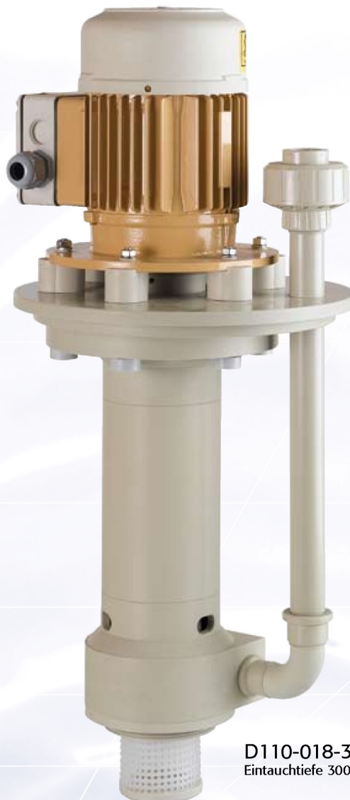
D110-018-300 Eintauchtiefe 300mm